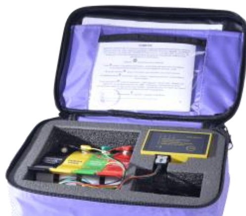
Рис. 1 Прибор в комплекте

КардиРу - медицинский прибор для регистрации ЭКГ в домашних условиях или в стационаре клиники. Прибор регистрирует электрокардиограмму (ЭКГ 6 стандартных отведений I, II, III, aVR, aVL, aVF) покоя в течение 30 секунд от четырех электродов с рук и ног. Исследование передается от прибора КардиРу по Интернет-каналу сотового оператора (сим карта сотового оператора поставляется в комплекте с прибором) или по любому Wi-Fi. После исследования в личном кабинете владельца прибора или в мобильном приложении формируется ЭКГ, описание ЭКГ и автоматическое заключение, которое позволяет выявить острые состояния, отклонения на ранней стадии, а также следить за динамикой состояния сердечно-сосудистой системы при наличии патологии.